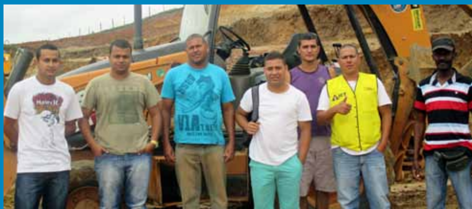
Aula prática com os instrutores do ICT em Volta Redonda

Equipe técnica responsável pelo sucesso na certificação dos operadores